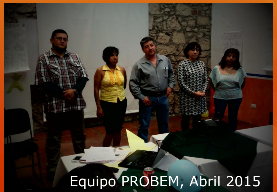
Equipo PROBEM, Abril 2015