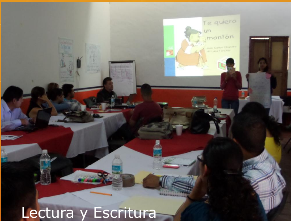
Lectura y Escritura