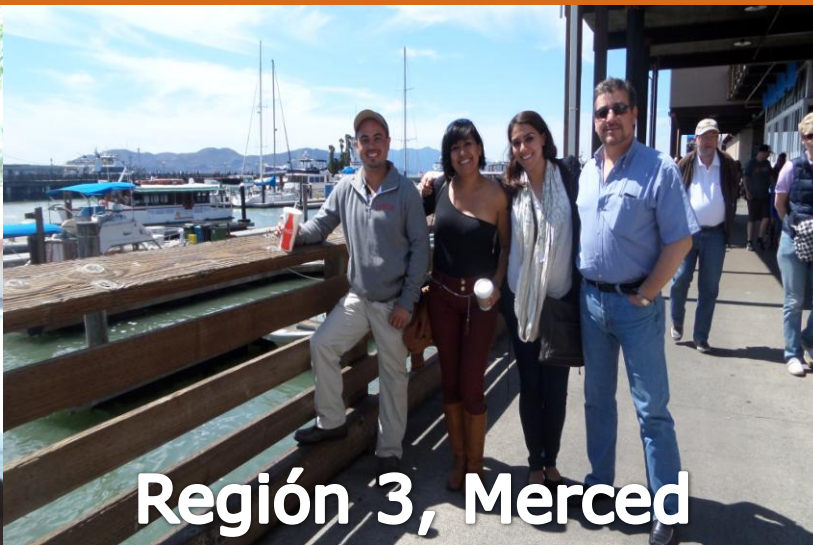
Región 3, Merced