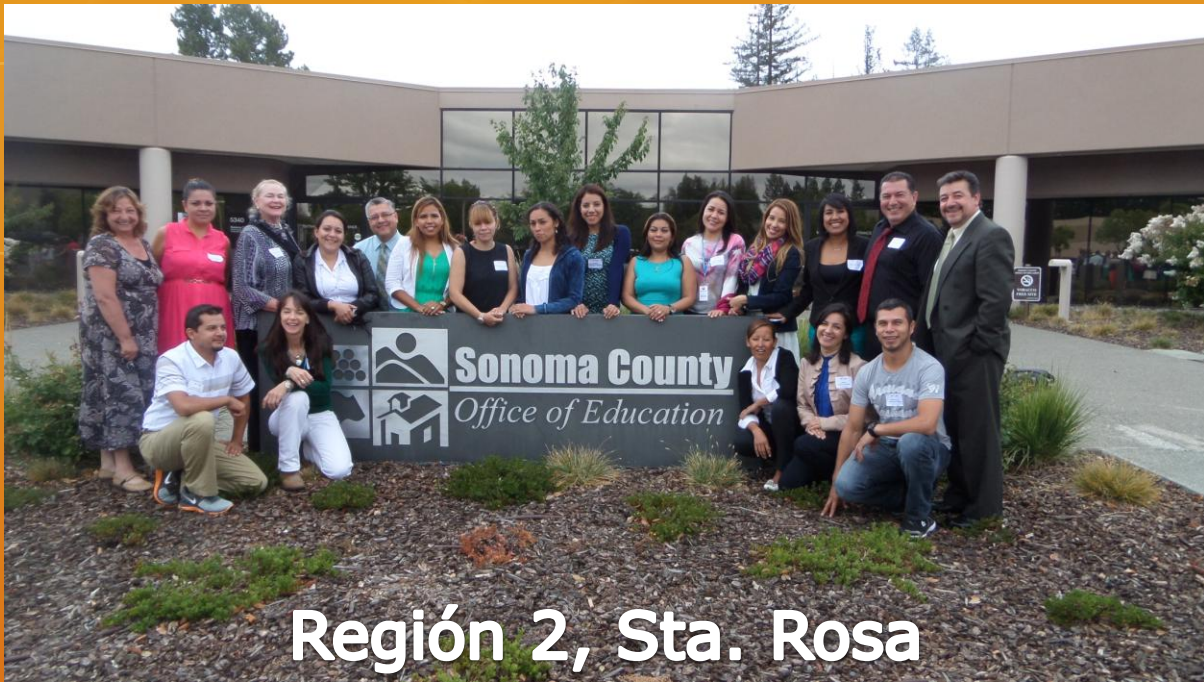
Región 2, Sta. Rosa