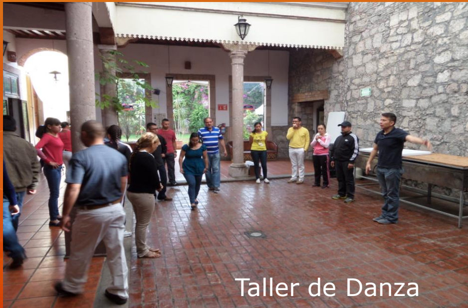
Taller de Danza