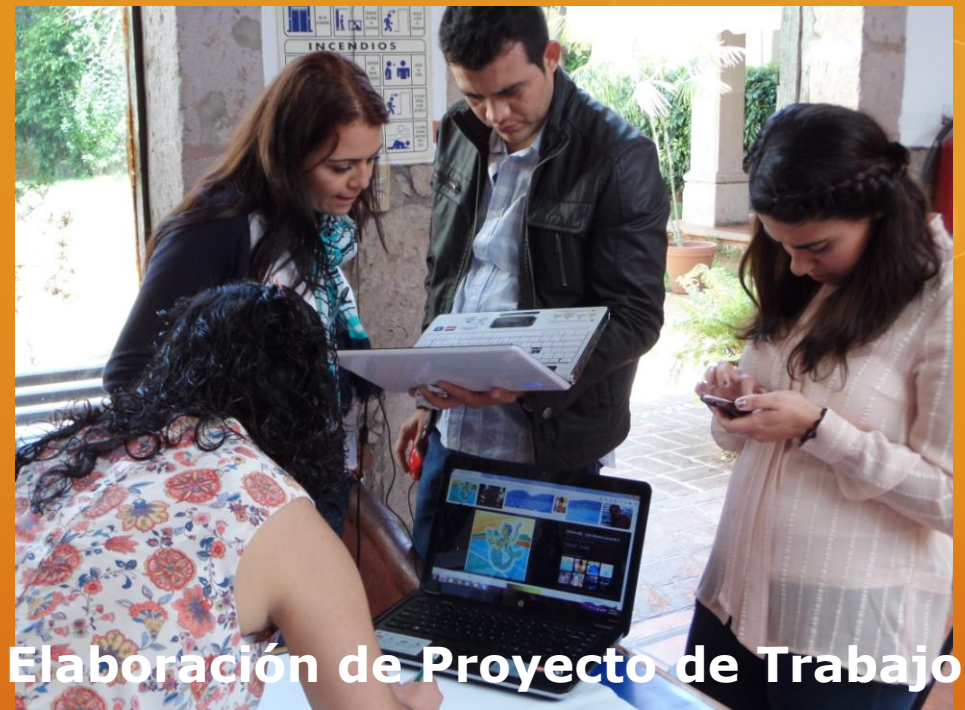
Elaboración de Proyecto de Trabajo