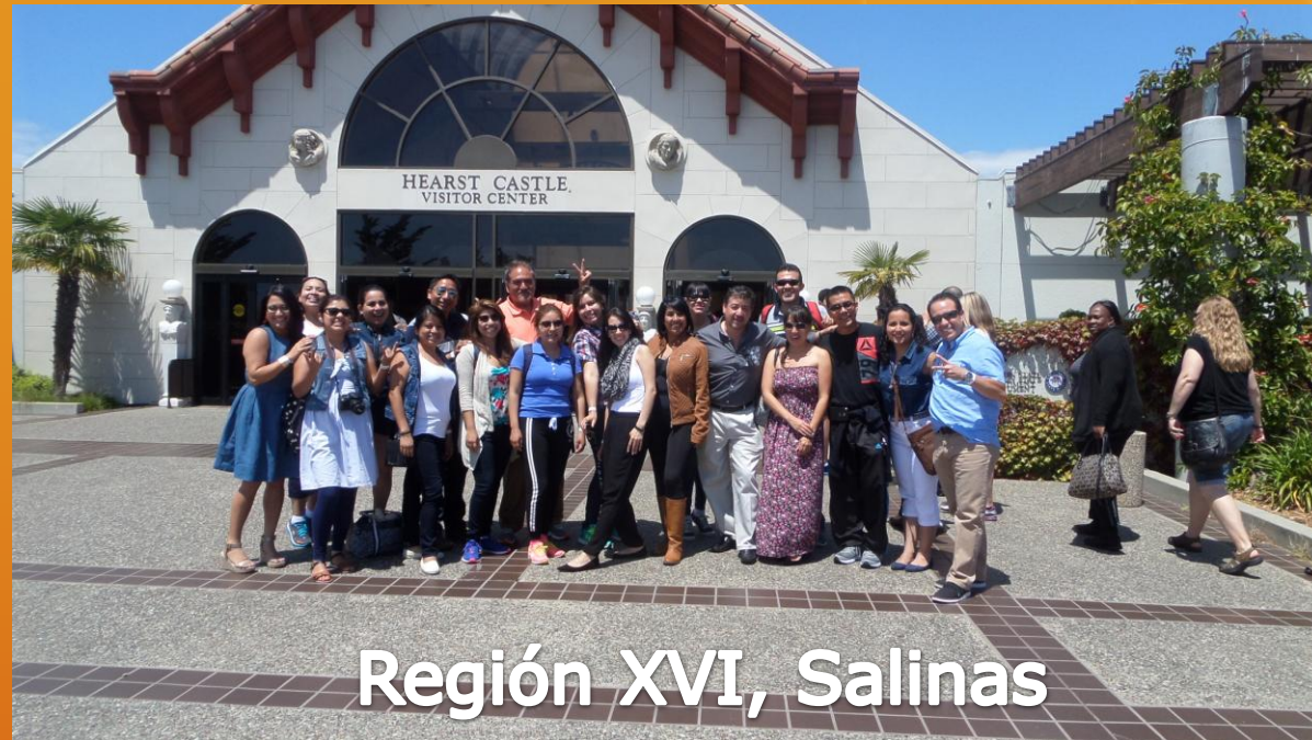
Región XVI, Salinas