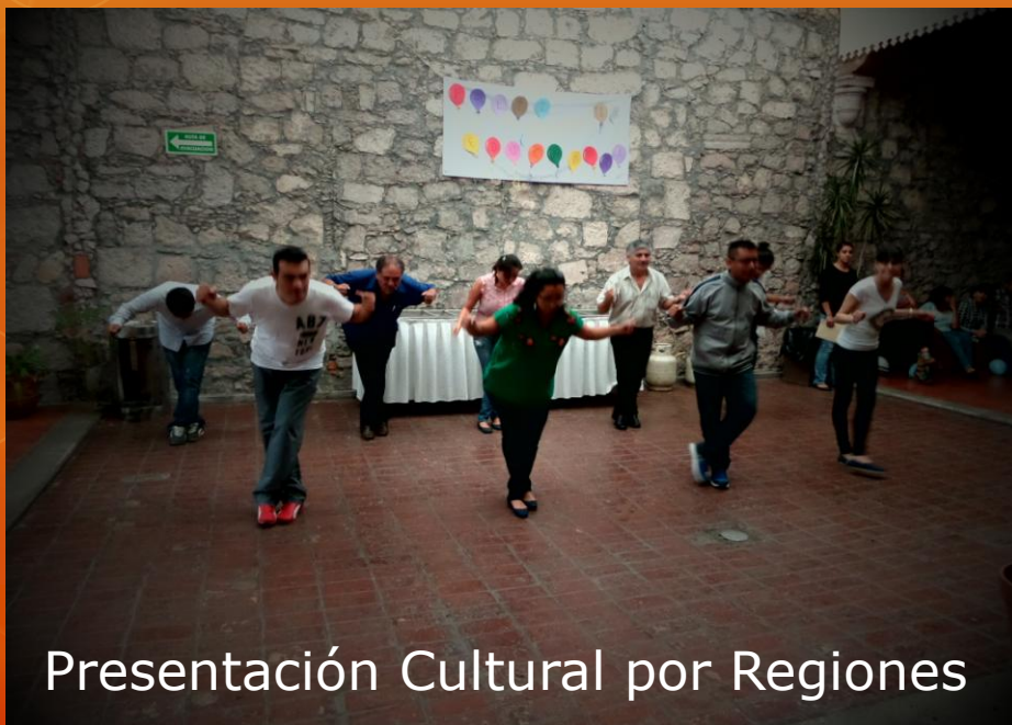
Presentación Cultural por Regiones